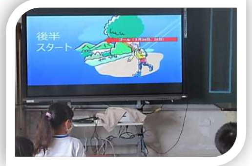
3月のゴールに向かってスタート