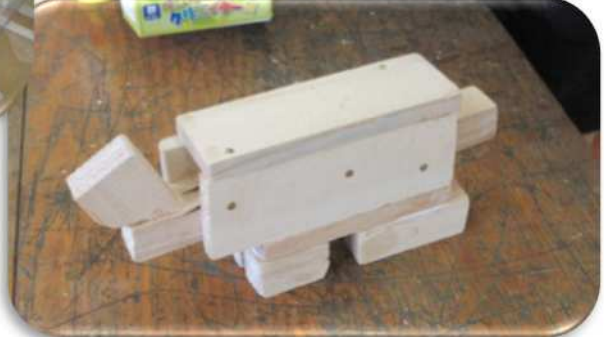
• キリで穴をあけて、ひっかけるようにしたい。 • 写真たてを作って、私の好きな茶色をぬりたい。 • 赤いカニや、カメが好きだから作りたい。 思い思いにアイデアを出して、すてきな作品ができた！