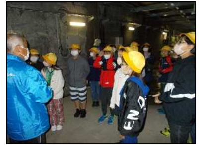
徳山ダムを見学する5年生

6年生は京都・奈良への修学旅行です。今年度は感染対策を講じて宿泊旅行です。日本の歴史的建造物について調べ学習をしたうえで、本物に触れる旅になりました。また仲間との宿泊や食事、長時間のバス移動では、ルールやマナーを守って互いに思いやりの心をもつことも大切です。