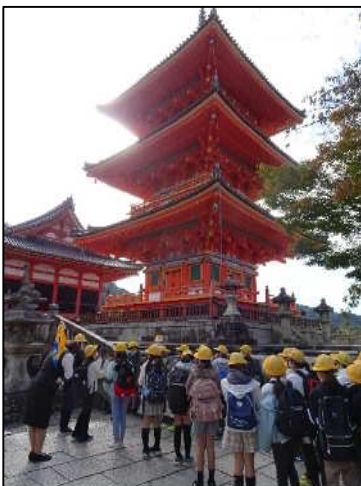
清水寺を見学する6年生