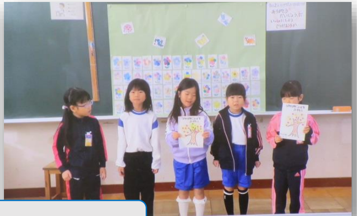
各学級の取り組みを発表しました。