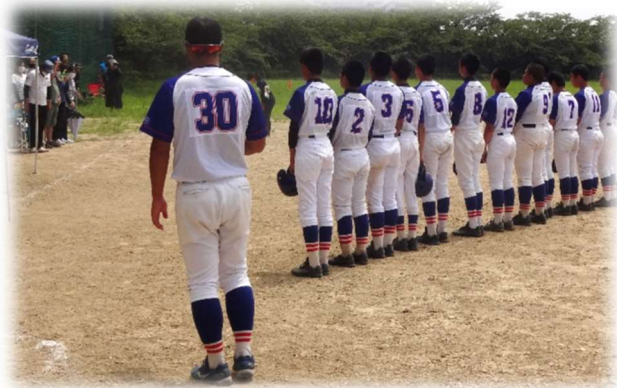
【野球部 (穂積北中グラウンド)】