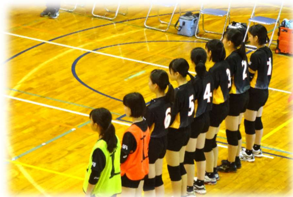
【バレーボール部 (巢南中体育館)】