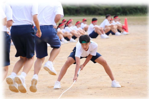
【懸命に縄を回す姿】