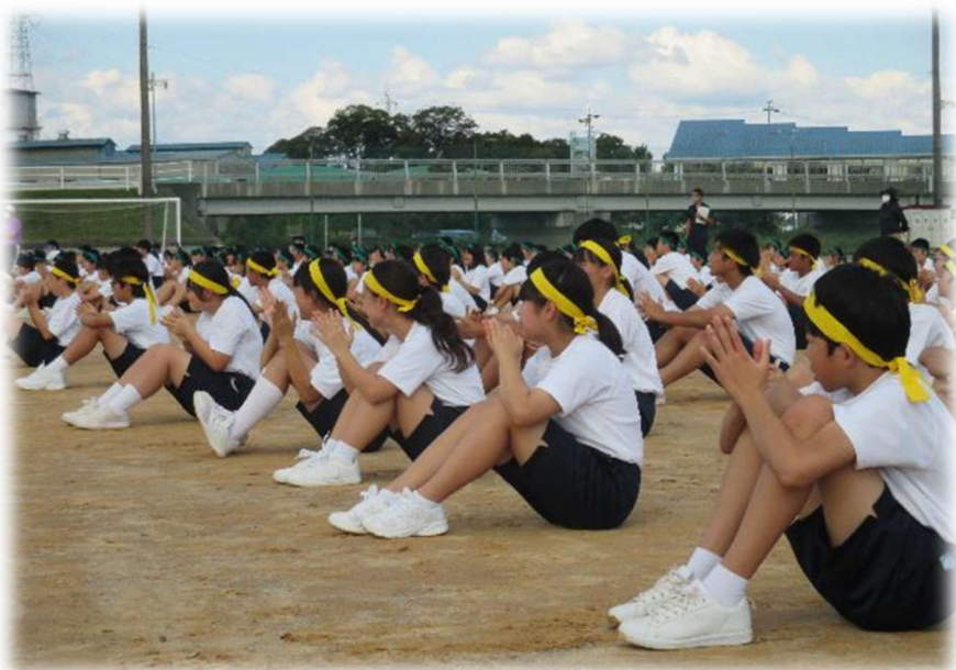
【仲間を応援する生徒】

生徒たちは現在、後期の組織づくりを行い、新たな一歩を踏み出そうとしています。仲間の声援を力にしながら、自分の弱さに負けない力強い歩みを続けていってほしいと願っています。