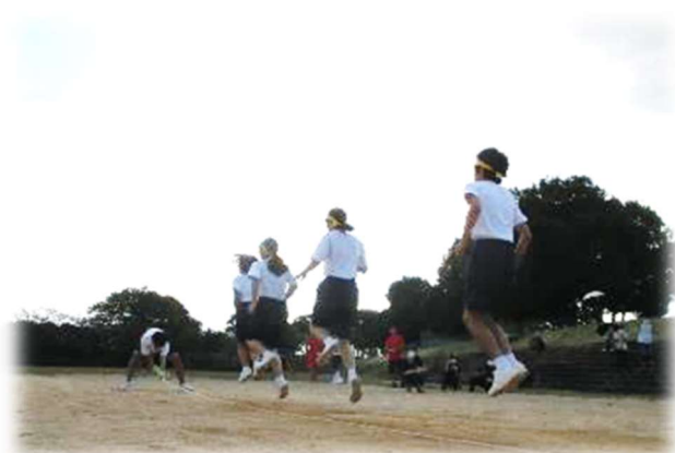
【心を一つに跳ぶ姿】