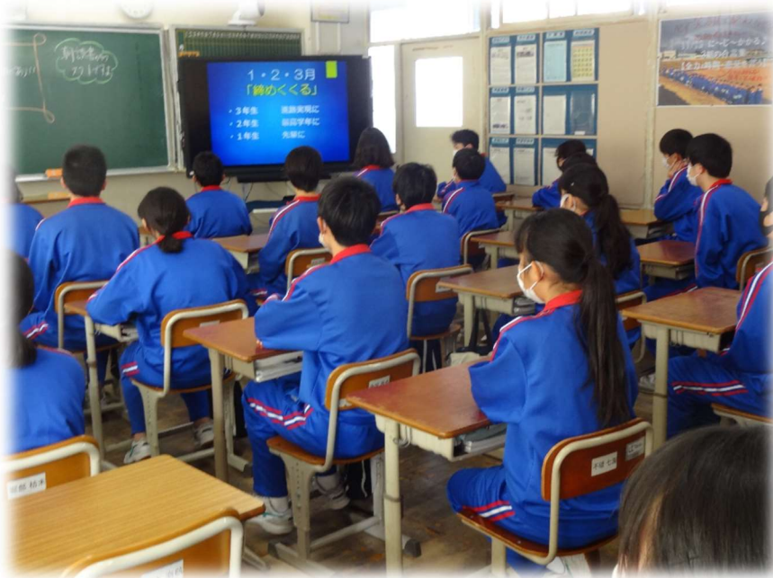
【冬休み明け集会の様子】