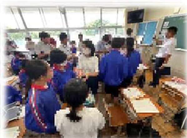
【グループ交流・・・自分の考えをより具体的にしたり、新たな考えに気付いたりしました】