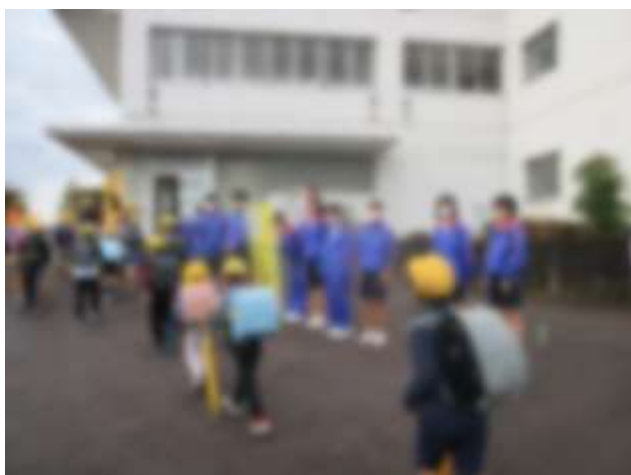
【生津小学校の様子(児童会と一緒に活動しました)】

活動を終えて中学校に登校した中学生は、「楽しかった」「小学生と一緒にあいさつできてよかった」「これからも中学校であいさつを大切にしたい」と言っていました。お互いにより時間になりました。