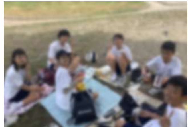
【お弁当タイム(サンコーパレットパーク)】