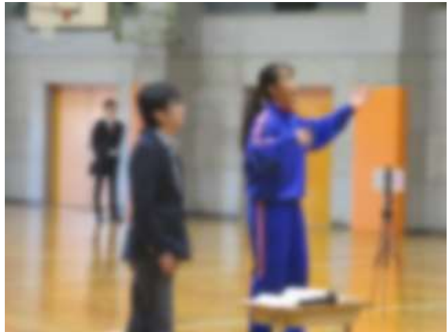
【学年合唱指揮者への指導の様子】