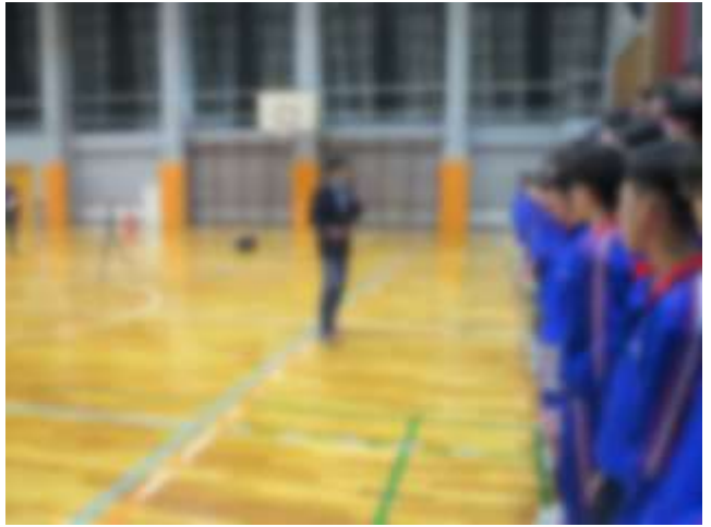
【学年合唱指導の様子】