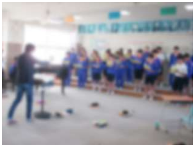
【指揮も振っていただきました】