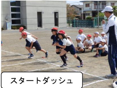
スタートダッシュ