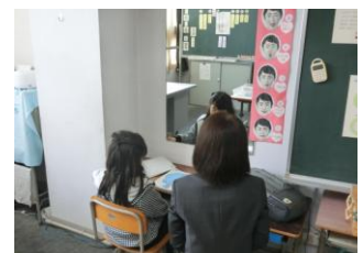
<言語通級> 「う行音を正しく出そう」

どの学級も学習委員会からの提案に基づき、自分たちの学級で決めた『いきいき授業』の姿をこの日の授業で示すことができたと思います。2学期終了まで残り1ヶ月ですが、更なる進化を期待しています。