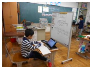
<なかよし学級>算数 タブレットを使った個応学習