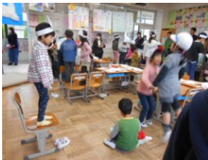
<1年生> 国語「くじらぐも」

穂積小学校では、平成32年度からの新学習指導要領の全面実施に向け、子どもたちが主体的・対話的に学ぶ『穂積小アクティブラーニング』の充実を目指して日々の授業に取り組んでいます。本年度は、特に、児童による学習委員会の活動ともタイアップしながら、「目チーム・へそチーム」を大切に話の聞き方や積極的に挙手をしたり、仲間の意見に反応したりしながら全体で追究していく『いきいき授業』のための目当てに向かって各学級で取り組みました。公表会での子どもたちの様子を紹介します。