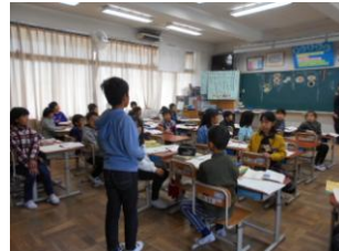
<3年生> 国語「すがたをかえる大豆」