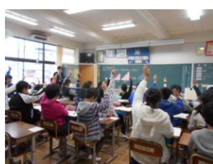
<6年生>算数 「比例・反比例」