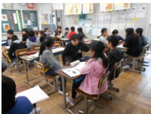
<5年生>国語 「大造じいさんとガン」