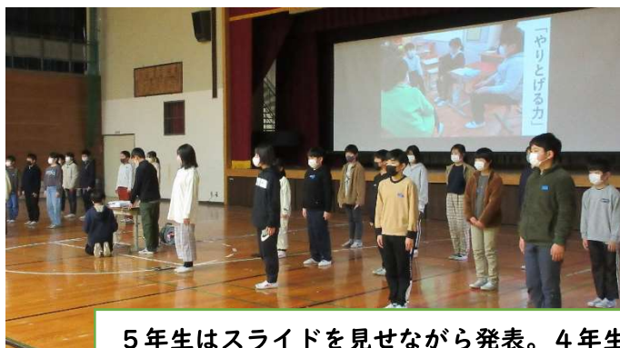
5年生はスライドを見せながら発表。4年生と交流。