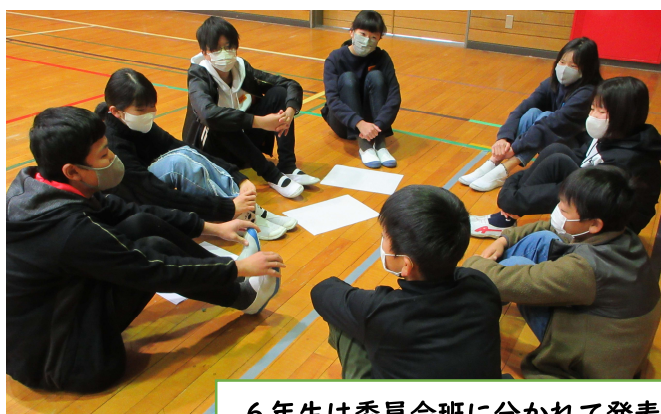
6年生は委員会班に分かれて発表。5年生と交流。