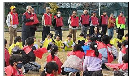
航空写真撮影に来てくださった地域の方々