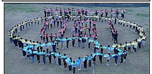
みんなで作った「かきりん」

☆ホームページについて右の2次元コードを読み取ると簡単にホームページをご覧ください。「ふなき」も載せてありますので、データで読んでいただくこともできます。どうぞご活用ください。