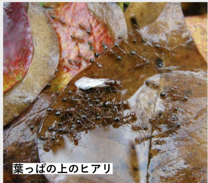
葉っぱ上のヒアリ