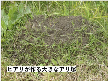
ヒアリが作る大きなアリ塚

これまで存在していなかった危険な毒アリが国内で現れています。 もし発見しても、 決して触らないでください！