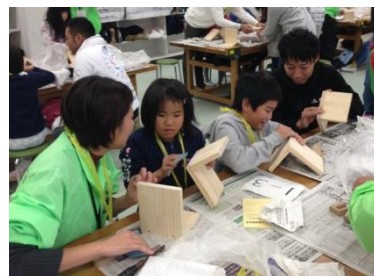
ブックエンド製作中の様子