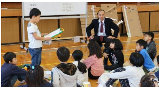
仲間の発言を真剣に聞く姿

理科では、課題を解決するための実験に子どもたちは仲間と協力して取り組んでいました。生活科では、自分たちが作った物がさらによくなるた