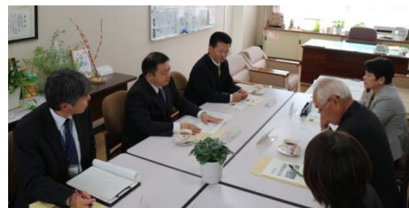
校長室での学校評議員会の様子