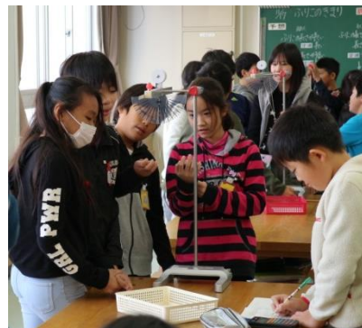
ふりこの周期を調べる児童の様子