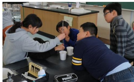
水の体積変化を調べる児童の様子

当日の活動がスムーズに進むよう十分な準備をしていただいた、PTA役員の皆さまには、心から感謝いたします。ありがとうございました。