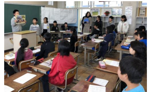
5年生 スピーチの様子