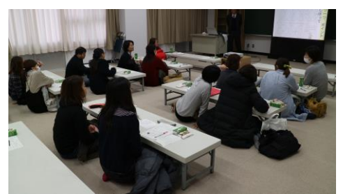
参加者同士での意見交流