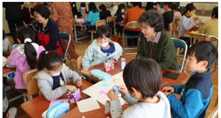
瑞穂大学受講生と3年生児童との交流

本年度、瑞穂市在住の高齢者を対象とした瑞穂大学の会場が牛牧小学校になっています。2月20日(火)、瑞穂大学の受講者と本校の3年生児童が交流をしました。各グループに受講者の方がお一人ずつ加わり、一緒に折り紙やゲームを楽しみました。ふだんの生活で折り紙をすることも少なくなり、一枚の紙がいろいろな形に変化していくことに子どもたちは驚いていました。また、受講者の方は「子どもたちの気持ちのよいあいさつや笑顔から元気をもらいました。」と話されました。教室に笑顔があふれる素敵な交流となりました。