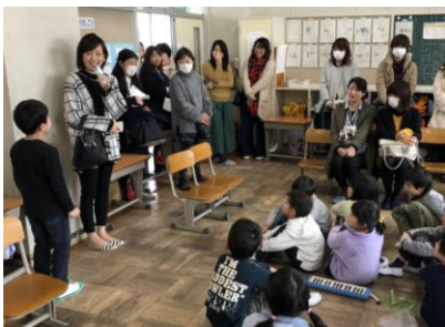
1年生 インタビューの様子

それぞれの学年で、子どもたちの成長している姿を感じることができたことと思います。多くの保護者の方に参観していただきありがとうございました。