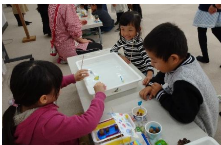
保育園児と一緒に活動する1年児童

理科では、根拠のある予想や仮説をもとに見通しをもって問題解決していく姿を見てもらいました。生活科では、自分たちが作った物がさらによくなるための工夫やより楽しい遊びになるための工夫をしている様子を見てもらいました。以下のような参観者の感想をたくさんいただきました。