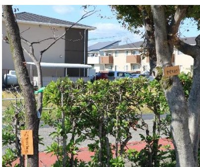
新しい名札が掛けられた校庭の樹木

描いたり、その植物について調べたことを書いたりしました。雨風にあたっても大丈夫なように、最後はニスで仕上げました。ニスが乾く間には、参加者全員で楽しいゲームもできました。現在、校庭には新しい木札が付けてあります。学校へお越しの際には、ぜひ、ご覧になってください。