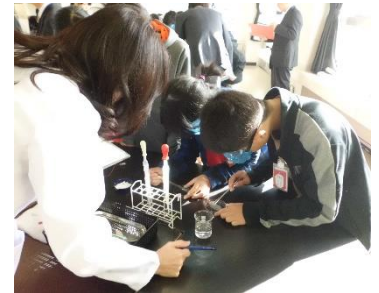
仮説をもとに実験に取り組む6年児童

11月16日(金)、全国小学校理科研究協議会研究大会のプレ大会を兼ねた公表会を行い、保護者、市内外の先生、教育委員会の先生方に授業の様子を見ていただきました。本校は「生き生きと追究する児童の育成」という研究主題で理科、生活科の授業づくりに取り組んでいます。