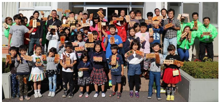
参加者全員での記念撮影

11月10日(土)、PAPA'S活動で校庭に植えてある樹木の名札を作りました。牛牧小学校の校庭には、たくさんの木々があります。それぞれの木々には、その木の植物名が書かれたプラスチック製の名札が掛けてありましたが、かなり以前に作られたもので傷んでいました。そこで、今回の活動で製作することとなりました。製作前に、校庭にどんな木があるのか参加者で確認した後に、どの木の名札を作るか作業分担して、作業に取り掛かりました。木札の表面に植物名を書いた後、裏には、葉や花の形のイラストを